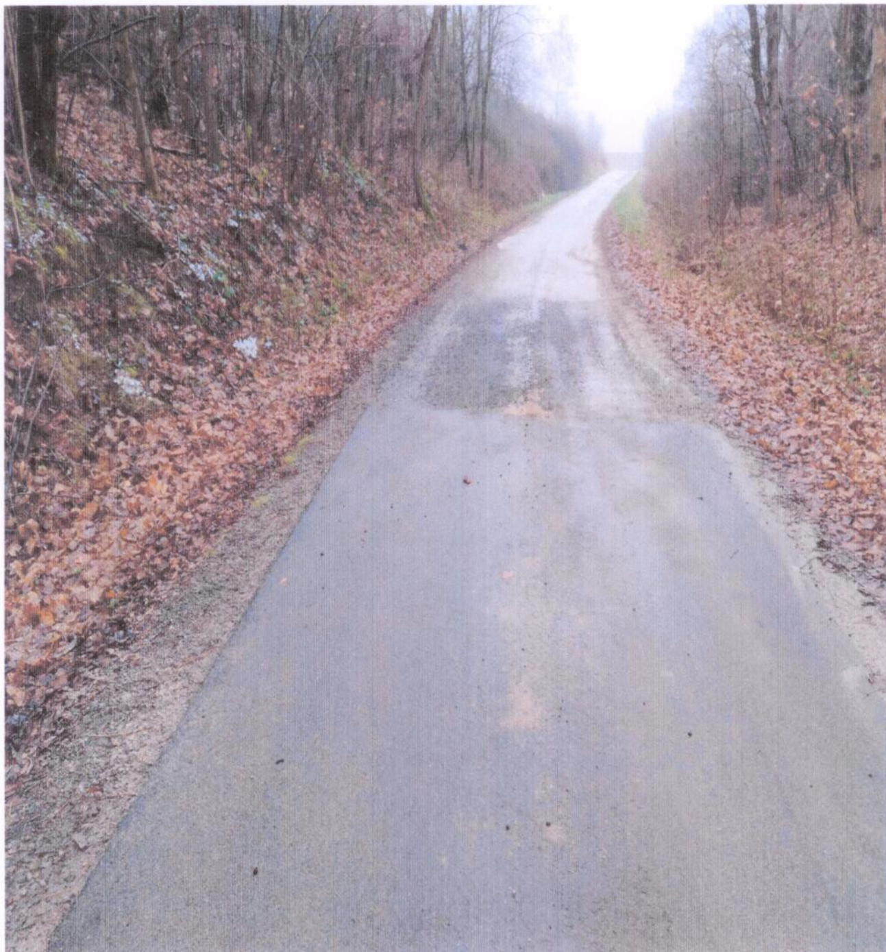
Fot . 1